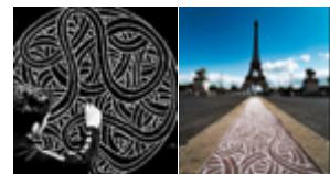
Jordane Saget traces à la craie